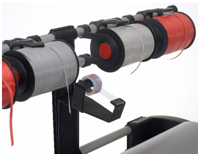
Klebebandspender Best.-Nr.: 120301