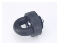
Befestigung mit Schraube für Griffstock Best.-Nr. 63515