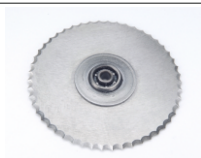
Kassetten-Kreismesser für Papier, Wellpappe etc. Best.-Nr. 625010