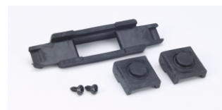
Satz Gleitschuhe für Schneidschlitten Best.-Nr. 63525