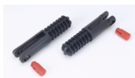
Haltegabel mit Bolzen (1 Paar) für Klemmstange Best.-Nr. 63521