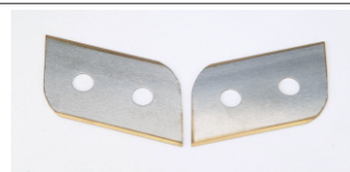
Kassettenklingen 2-teilig, für Folien Best.-Nr. 6250200