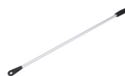
Griffstock mit Kunststoff-Aufhängung Best.-Nr. 63510