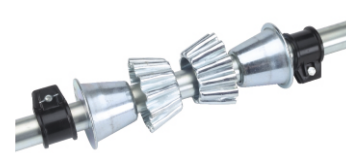
Konen mit Klemmrings (1 Satz) Best.-Nr. 62/11