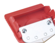
Kassette mit Klingen 2-teilig für Folien Best.-Nr. 62502N