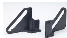
Seitenführungen (1 Paar) für Klemmstange Best.-Nr. 63520