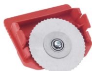
Kassette mit Kreismesser für Papier, Wellpappe etc. Best.-Nr. 62501